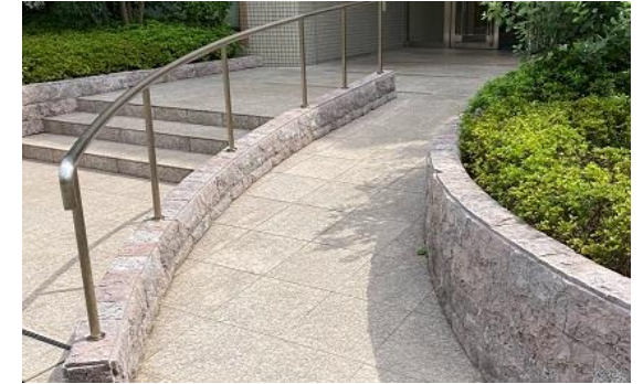
□歩行訓練スペース