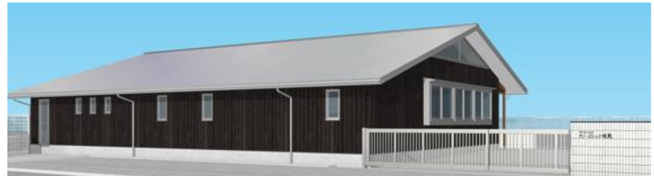
□建物は昔ながらの焼杉板と大きな切妻屋根が特徴です